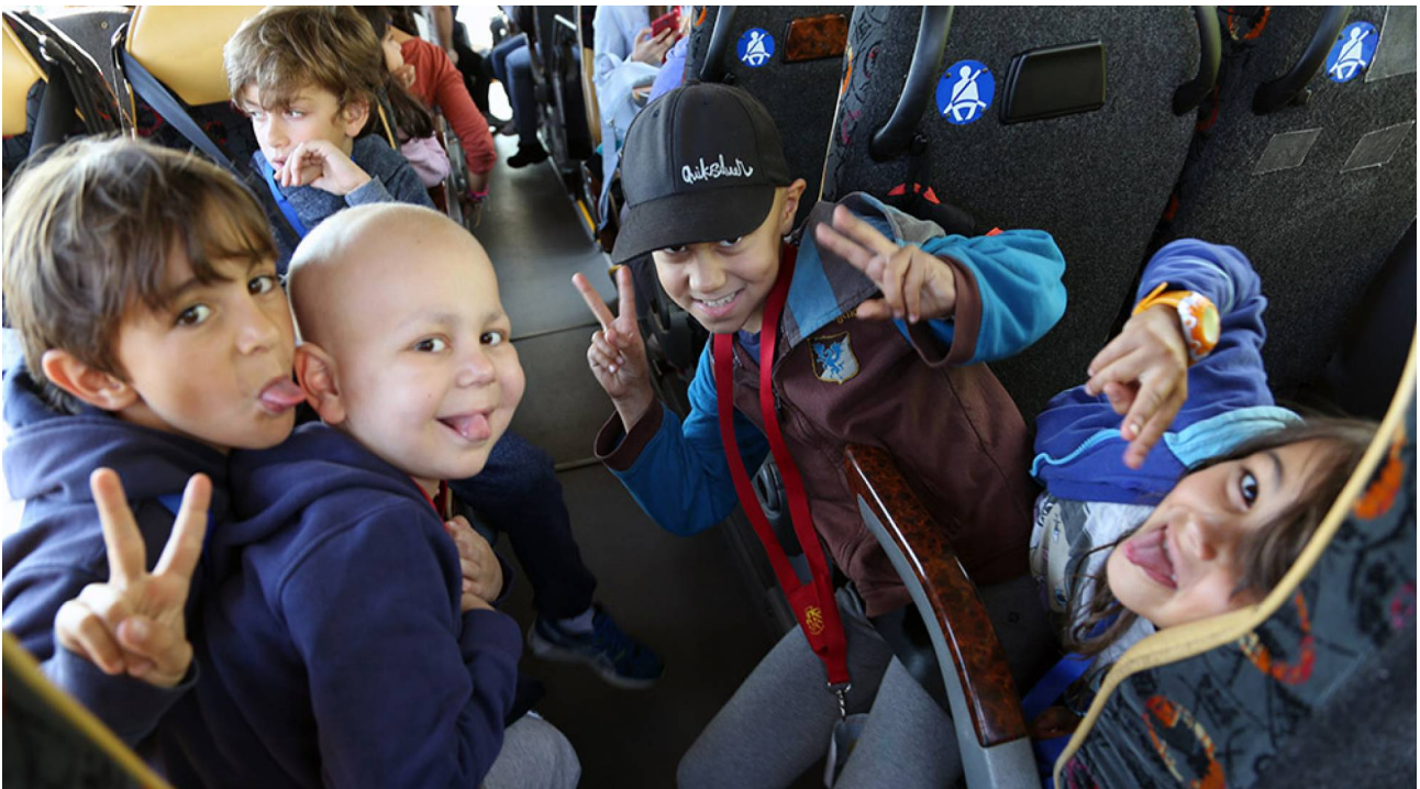
Niños de la Fundación Blas Méndez Ponce de excursión. FUNDACIÓN BLAS MÉNDEZ PONCE